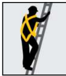
Ascenso - Descen-